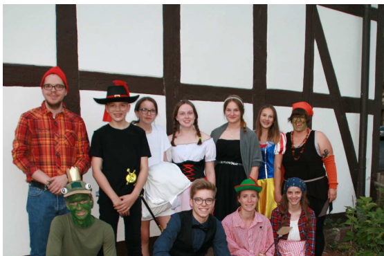
Das kreative Freizeit-Team